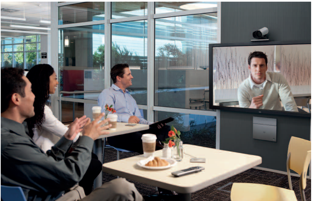
Photos in the Cisco Chapter. Unauthorized use not permitted.

Mit maßgeschneiderten Lösungen unterstützen wir Sie beim Aufbau des erforderlichen Technologie- und Spezial-Know-hows auf Ihrem Weg zum Cisco Channel Partnerstatus.